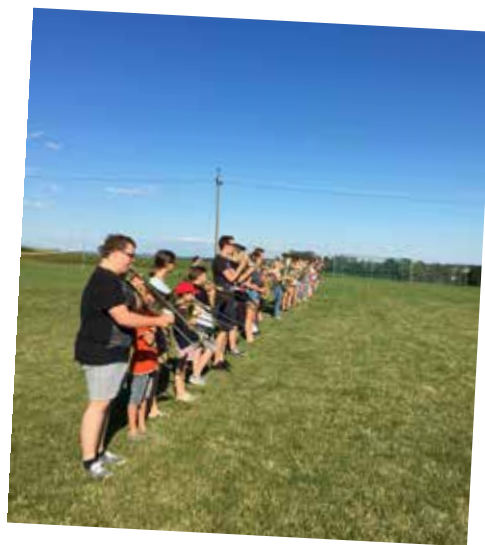
Spielenachmittag mit Marschprobe